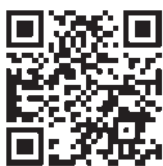
LOVE BLUE 公式Facebook

是非、フォローいただくとともに、いいね！や情報拡散などにご協力くださいますよう、お願ひ申し上げます。