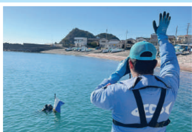
LOVE BLUE 水中清掃