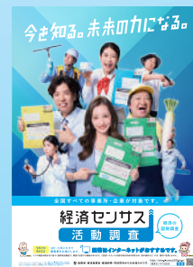
令和8年経済センサス-活動調査