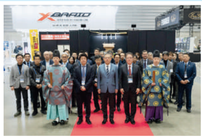
釣りフェス2026 成功祈願