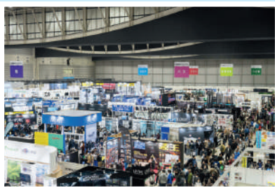
釣りフェス2026 会場風景