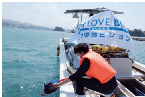
熊本県 カサゴ 総放流数 7万6800尾