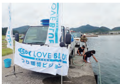
山口県 マダイ 6万5000尾