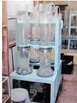
兵庫県 加古川漁業協同組合 4連式孵化器