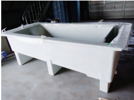
北海道 西網走漁業協同組合 自然産卵水槽

水産庁後援 内水面釣り場拡大事業（ワカサギ）は、本年度も、全国からの応募受付（期間6/21～9/30）を開始致しました。応募要領は水産庁から各都道府県担当部局、全国内水面漁業協同組合連合会から各都道府県内水面漁業協同組合連合会等、さらに、中央水産研究所内水面センターから各都道府県水産試験場へ配布・周知されています。