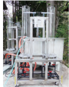
栃木県 川俣湖漁業協同組合 2連式孵化器