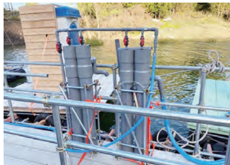
宮城県 花山漁業協同組合 4連式可搬型孵化器