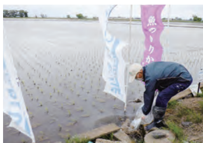
滋賀県 ホンモロコ 総放流数400万尾