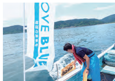
宮崎県 カサゴ 総放流数 8万3333尾