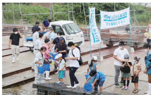
大分県 ヒラメ 総放流数 4万3400尾