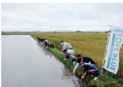
滋賀県 ゲンゴロウブナ 総放流数250万尾