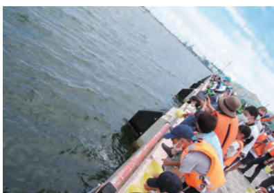
静岡県 ヒラメ 総放流数 2万尾