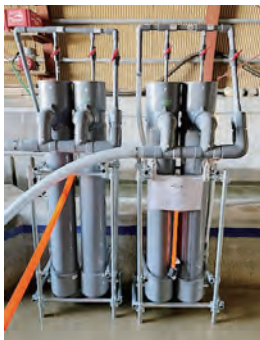
新潟県 魚沼漁業協同組合 4連式可搬型孵化器