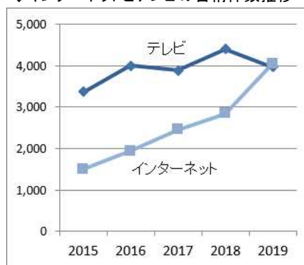
◇インターネットとテレビの苦情件数推移

見解についても、対象媒体 1 位が「インターネット」という状況が続いており、2019 年度は見解 34 件中 28 件と 8 割にも上った。そのうち、悪質なアフィリエイトプログラム(広告主の依頼を受けてアフィリエイターや広告会社等が制作・運用する成果報酬型の広告)が関わった事例は 18 件あり、①広告(ニュースサイトや SNS のインフィード広告が多い)、②アフィリエイトサイト、③広告主の自社通販サイトの順でリンクしたものが目立った。また、アフィリエイトサイトには ASP のほか、ウェブサイト制作会社、広告会社などが関わるものもあり、警告を発信した何件かは、広告会社等が共通しているものも見られた。インターネット上の悪質な表示は数も多く、他団体や会員企業などとも協力して取り組みを進めたいと考えている。